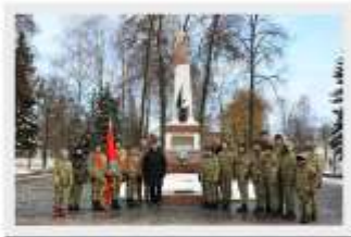
Акция прошла у мемориального комплекса в парке имени

13 декабря члены патриотических клубов ГУО "Гродненская городская гимназия имени А.И. Дубко", "Гимназия № 10 имени Митрополита Филарета (Вахромеева) г. Гродно", "Средняя школа № 2 имени В.Ю. Саяпина г. Гродно", "Средняя школа № 8 г.Гродно", а также «Циркон» приняли участие в городской акции и поддержали флешмоб памяти против преступного беспамятства народов, которые получили свободу и возможность жить под мирным небом благодаря жертвам советских солдат.